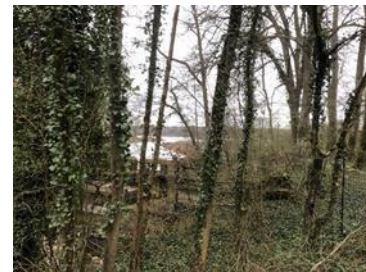
b) déversoir montagnes de sédiments, entrée du chenal (absence d'entretien)

Le fonds du lac s'élève 0,5cm par an suite à la décomposition de la végétation aquatique (très abondante à Virelles, lac multiséculaire, hypereutrophe), des macroalgues, du phyto et zooplancton ainsi qu'à la suite de l'apport des matières minérales apportées par le Ry Nicolas.