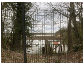
a) partie est atterrissement complet (absence d'entretien)