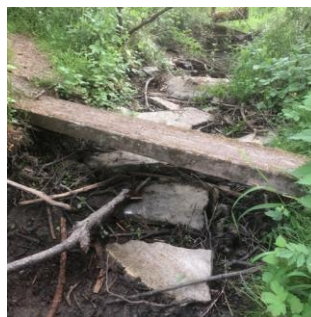
Petit ry obstrué volontairement par des plaques minérales