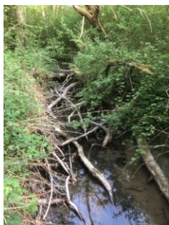
Petit ry obstrué par des branches

b) L'état des lieux des petits rys (propriétaire Natagora) entre la route de Virelles-Froidchapelle et le lac