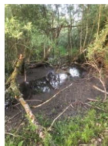
Petit ry colmaté (entrée du lac de Virelles).....