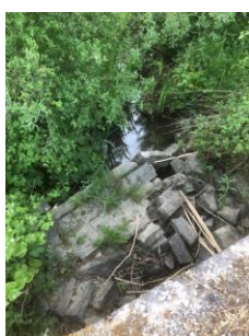
Mur route Virelles-Froidchapelle écroulé dans le ry (sans commentaires)